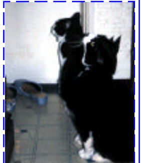
母親がトイレから出るのを待つ、キュー・クロちゃん

そんな猫が一緒に楽しい生活の中、「クロちゃん」の具合が悪くなったのは昨年の7月頃からでした。時々口の中から出血するようになり、検査の結果血液の病気ということが判明したのです。口の中に潰瘍ができ、出血を繰り返し、何度か入院という事態になりました。そして今年の7月、今度は「キューちゃん」の元気がなくなり、急に食べなくなりました。水分もとらなくなり脱水と衰弱が目立つようになり、点滴を決意しました。初めての経験でしたが、毛を剃り前脚に何とか点滴を入れることができました。外来で子供たちが回復していく姿とは異なり、経過が思わしくなかったため、やはり専門家の獣医の診察を受けることにしました。そして診断の結果、病名は全く予想しなかった糖尿病だったのです。1週間程度入院の後、連日のインシュリン注射が始まりました。風邪は万病の元といわれるように、風邪を契機に糖尿病が悪化し、入院したこともありました。最