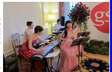
琴も入った五重奏