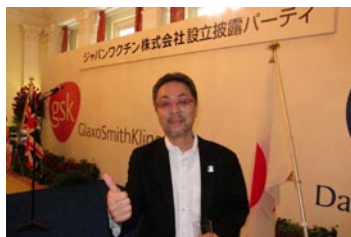
いつもの決めポーズの院長