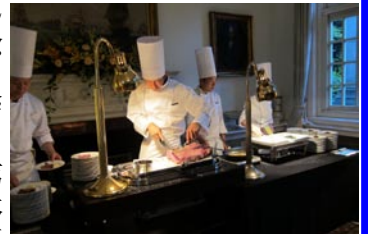
ローストビーフのサービス

それにしても昨年11月の総理大臣官邸に引き続き、今回は英国大使公邸。理由は異なるにしても、官邸と公邸に招待される幸せな小児科医です。これも多くの方々に評価されている証です。もちろん参加できるのは、皆さん方のご理解とご協力のお陰です。ありがとうございました。