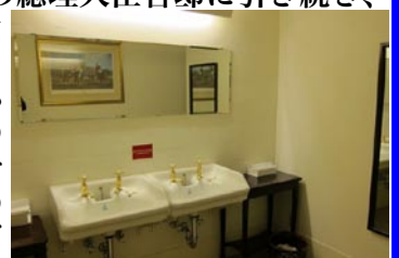
トイレの蛇口が金: 英国風?