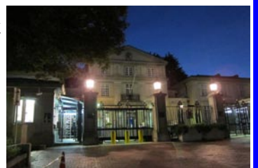
夕やみに浮かぶ英国大使館