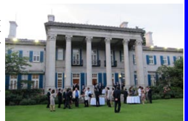
庭園から見た大使公邸