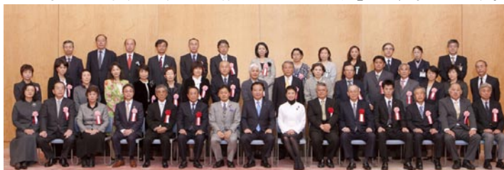
集合写真（中央が野田総理、右が蓮舫大臣。さて院長は？）

食事の後は、式次第の説明と官邸での注意を。官邸はカメラ持ち込み禁止と聞かされ、顔から血が引いていくような気分。ここからが裏話。受賞したのは内閣府特命担当大臣表彰、大臣はご承知のように蓮舫さん。せっかくだから是非とも蓮舫大臣とツーショットをと。と言っても、まさか当日お願いする訳には。よしとばかり民主党繋がりを利用するしかない、待合室に飾ってある写真の郡和子衆議院議員に電話を。郡さん「大丈夫、よく知っているので先生の希望が叶うように連絡しておきます」と、快い返事。