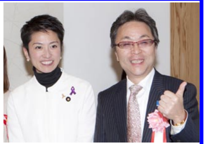
蓮舫大臣（顔小さい）とツーショット

やはり持つべき友は国会議員かも。説明を受けた後、ほどなく内閣府の担当者があいさつに。「大臣と写真を取れますので、式典終了後別室に案内しますので」と。もちろん表情は変えず、「やった～やった～」と何度も心の中で叫んでた。